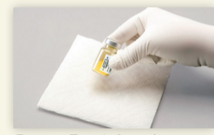
Figure 2 : Taper le flacon fermement pour mélanger.