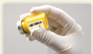
Figure 4 : Secouer vigoureusement le flacon.