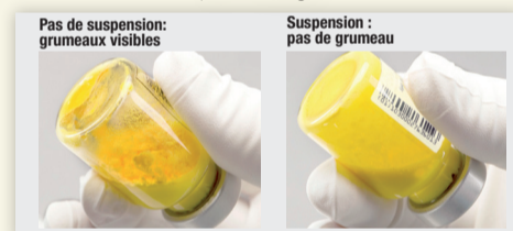
Figure 3 : Vérifier si de la poudre n'est pas en suspension et taper à nouveau si nécessaire.