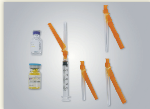
Figure 1 : Contenu du conditionnement.

Le conditionnement contient : (voir Figure 1)